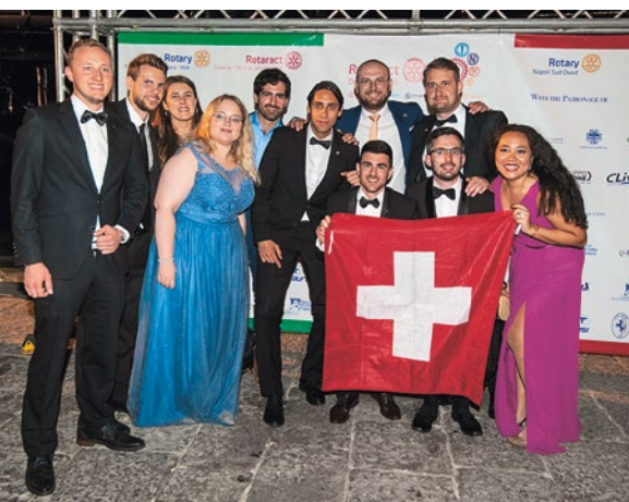
REM «Vesuvius Express» a Napoli